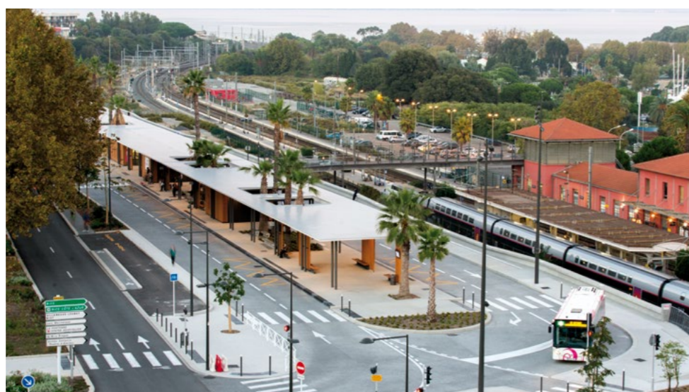
Pôle d'échanges d'Antibes

KEF • Journal réalisé par la Communauté d'Agglomération Sophia Antipolis